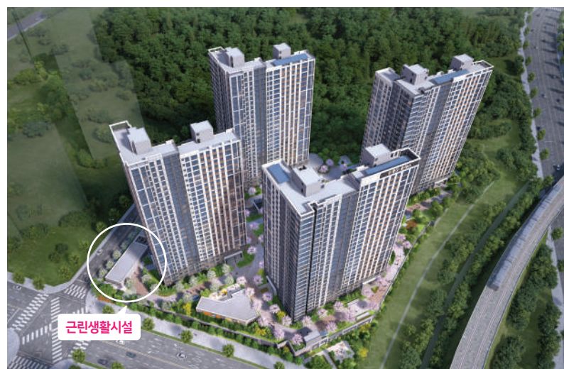
※ 상기 조감도는 소비자의 이해를 돕기 위해 제작된 CG컷으로 축면 그래픽, 문양 및 외부색채, 단지조경, 세부식재, 외관 디테일 등은 실제 시공 시 세부계획이 변경될 수 있습니다.