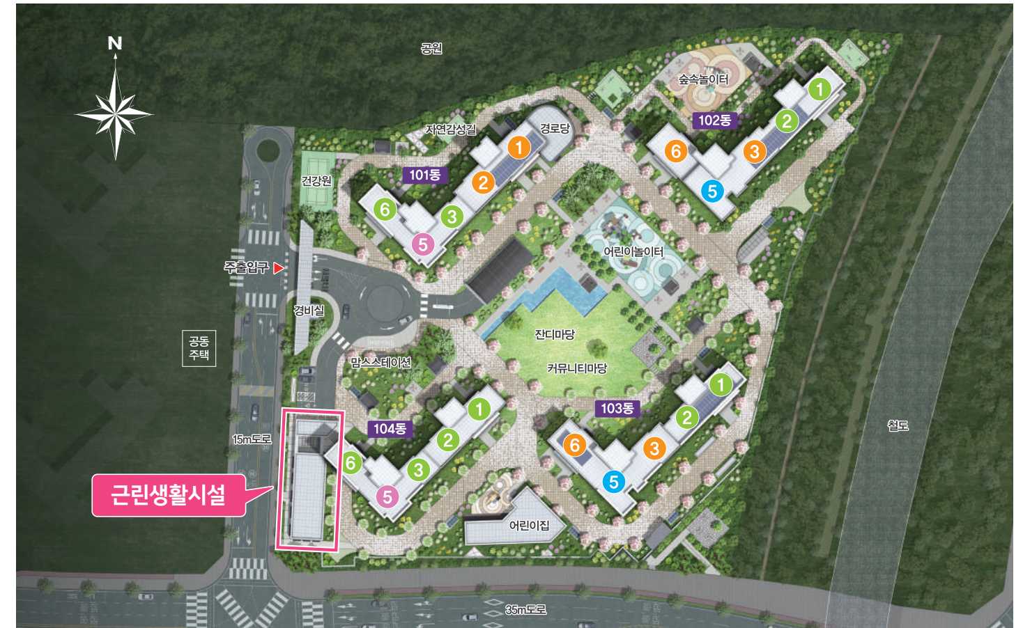
※ 상기 단지배치도는 소비자의 이해를 돕기 위해 제작된 CG컷으로 축면 그래픽, 문양 및 외부색채, 단지조경, 세부식재, 외관 디테일 등은 실제 시공 시 세부계획이 변경될 수 있습니다.